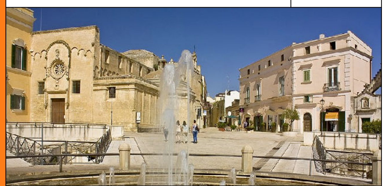
TAVOLA: A.2.2.e Scala - 1:5000

COMUNE DI MATERA Assessore Pianificazione urbanistica e gestione del territorio Dott. Nicola TROMBETTA Assessore Protezione civile Ernesto BOCCHETTA Dirigente Urbanistica Ing. Giuseppe MONTEMURRO Componente C.O.C. Geom. Antonio VAMMACIGNO PROGETTISTI Ing. Massimo MAGGIO Dott. Pietro SCALCIONE SUPPORTO SCIENTIFICO Ing. Giovanni ALBANO Ing. Raffaele ALBANO GRUPPO DI LAVORO Ing. Luciana GIUZZIO Dott.ssa Marica RONDINONE SISTEMA INFORMATIVO TERRITORIALE PAESIT Srl